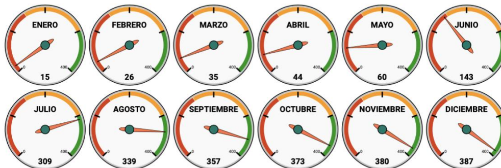
Evolutivo altas nuevo ingreso 2023